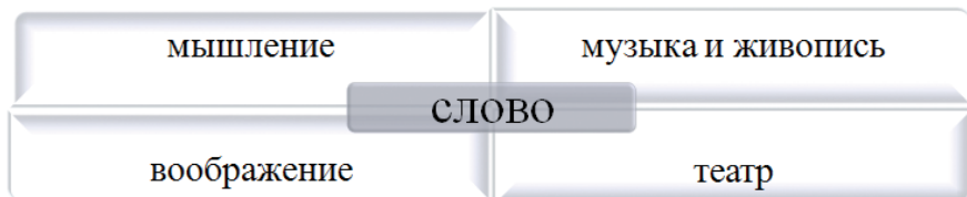
Рисунок 1 – Схема взаимосвязи слова с развитием важных психических процессов и средств эстетического воспитания человека

Прослеживается взаимосвязь слова с развитием важных психических процессов и средств эстетического воспитания: