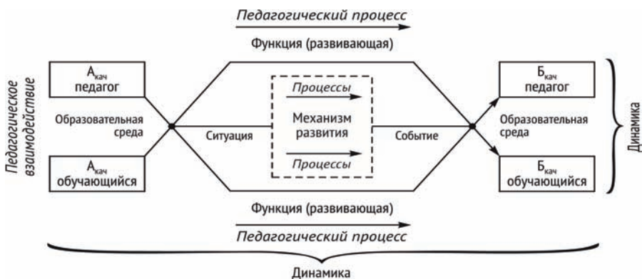
Рис. 1. Модель динамики педагогического процесса в образовательной личностно-ориентированной развивающей среде

Средовая целостность в динамике педагогического процесса просматривается как развитие личности в виде цепочки изменений, происходящей в образовательной среде в силу функции развития. Посредством личностно-развивающего механизма функция развития личности влияет на цепочку изменений (от «А» до «Б») в течение определенного промежутка времени, рассмотрим более схематично на рис. 1.